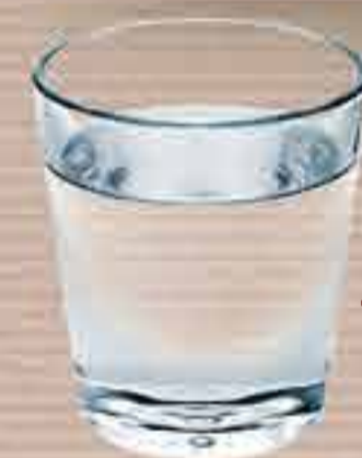
Tse robeli ka letsatsi